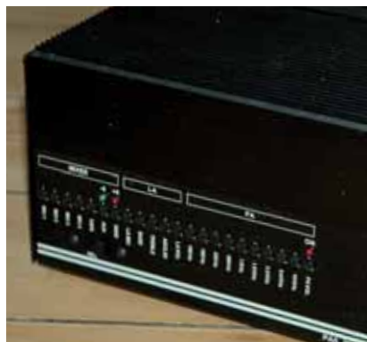
Sådan kan en teleslyngeforstærker se ud

Måske spekulerer du på, om det ikke er lidt for gammeldags at bruge magnetfelter til at overføre mikrofonlyd til et høreapparat. Og det er jo også længe siden, at H.C. Ørsted levede osv. Hvis du er bekendt med moderne hjælpemidler til kommunikation - som f.eks. computer - så ved du sikkert også, at der findes mange andre måder at sende signaler på. Det kan være de såkaldte Bluetooth-enheder eller Infrarøde signaler. Og hvis du bruger moderne