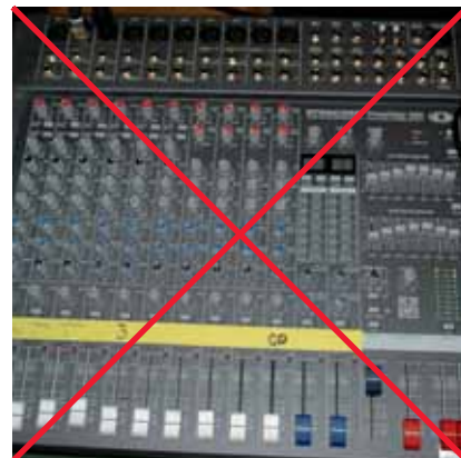
Et menighedsråd behøver ikke at vide en masse om teknik - blot, at et teleslyngeanlæg bør leve op til den standard, som blev beskrevet i det gamle teleslyngecirkulære.

høreapparater og hjælpemidler - så har disse jo allerede andre principper indbygget - som f.eks. radiosignaler til overførsel af lyd. Måske sidder du også i et menighedsråd og tænker, at man jo ikke skal indkøbe et nyt og dyrt anlæg uden også at have en vis garanti for, at det kan bruges mange år frem i tiden.