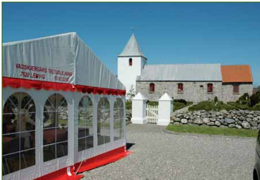
Teltet var slået op til samvær efter gudstjenesten i Hove kirke – den dag, det var sommer, 3. juni!

Efter at jeg så fik stillingen som sognepræst på stedet, har jeg erfaret,