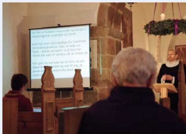
Eksempel på skrivetolkning ved en gudstjeneste i Hemmet kirke

Ritualet, eksempelvis, kan ved simultantolkning ikke gengives 100% nøjagtig. Der vil forekomme sammenfatninger/tolknin-