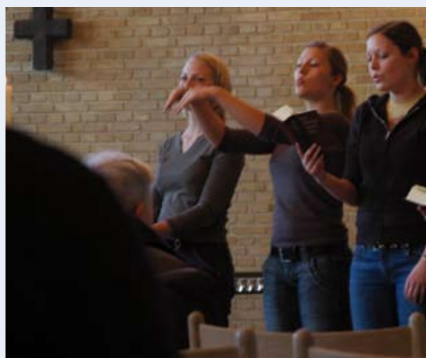
Eksempel på gudstjeneste, hvor der bliver tolket med Tegnstøttet Kommunikation. Fredenskirken, Århus

TSK-tolkning er ikke et 100% hjælpemiddel for alle hørehæmmede. Dvs. den detaljerede, faktuelle information, som er styrken ved eksempelvis tekstning, modtages kun, hvis man har lært TSK.