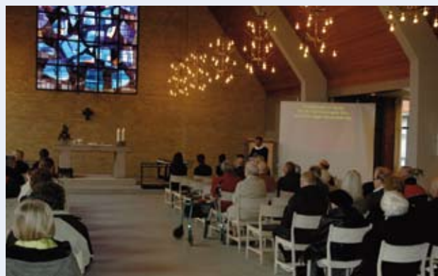
Eksempel på tekstning ved en gudstjeneste i Fredenskirken i Århus

Kræver en del yderligere forberedelse fra præstens side.