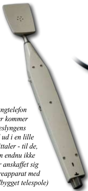
Fast mikrofon (med ledning)

Vær opmærksom på, at det bedste resultat nås ved, at der er kort og konstant afstand til mikrofonen. Der findes forskellige mikrofontyper. Den, der sørger for den bedste lyd, er umiddelbart en trådløs hovedbåren mikrofon, men der kan være grunde til, at menighedsrådet foretrækker en anden mikrofontype. Hvis flere mikrofoner anskaffes, f.eks. til præst og kordegn, bør det sikres, at de kan være tændt samtidig.