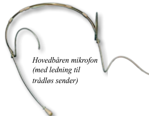
Hovedbåren mikrofon (med ledning til trådløs sender)