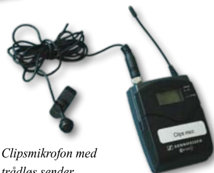
Clipsmikrofon med trådløs sender