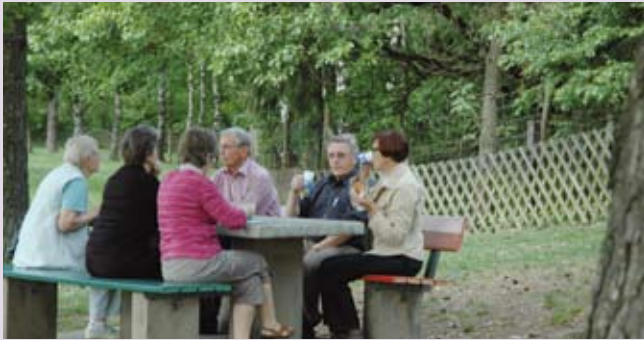
Kaffe i det fri (rejse til Luxembourg forår 2009).