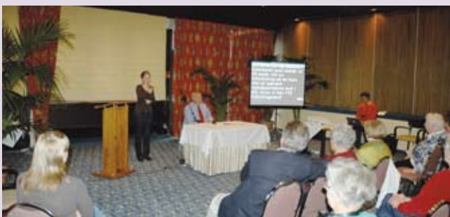
Den danske ambassadør Ole Lisborg fortalte om Luxembourg (rejse forår 2009).