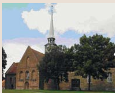
Sankt Nicolai kirke i Aabenraa Aabenraa Provsti Haderslev Stift