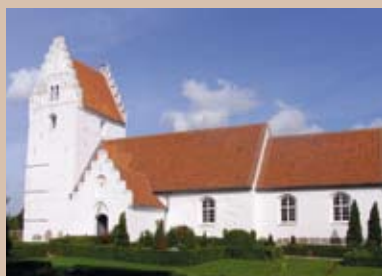
Revninge kirke Kerteminde Provsti Fyens Stift