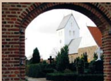
Skjern kirke Skjern Provsti Ribe Stift