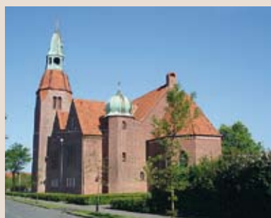
Zions kirke i Esbjerg Skads Provsti Ribe Stift

Oversigt over kirker vest for Storeblælt, hvor der er installeret visuelle hjælpemidler (skærme). Listen er sorteret nogenlunde i rækkefølge, efter hvornår installationen er sket. Første gang i Zionskirken i Esbjerg i 2003-04. Skulle der være kirker, som er undgået bladets redaktør, hører vi gerne derom.