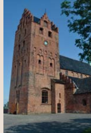
Sankt Nicolai kirke i Middelfart Middelfart Provsti Fyens Stift