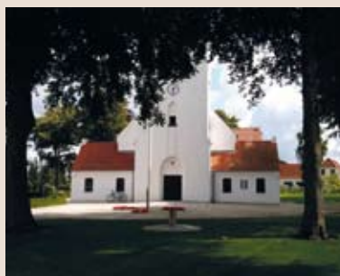
Videbæk kirke Skjern Provsti Ribe Stift