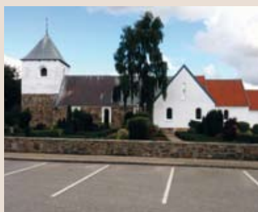
Aulum kirke Herning Nordre Provsti Viborg Stift