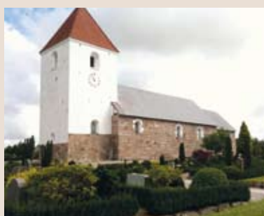
Farsø kirke Vesthimmerlands Provsti Viborg Stift