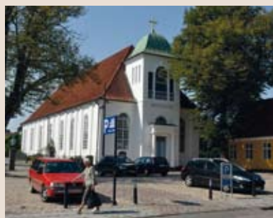
Sankt Michaelis kirke i Fredericia Fredericia Provsti Haderslev Stift