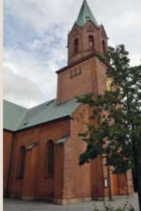
Silkeborg kirke Silkeborg Provsti Århus Stift

Ved de første installationer af skærme i kirken var der stor mediebevågenhed. Her fra Sankt Nicolai kirke i Aabenraa