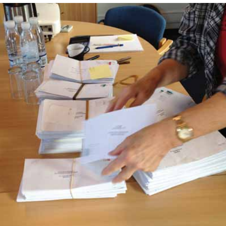
De mange stemmesedler ved valget blev talt op

I lighed med menighedsrådsvalgene har der også været valg til Folkekirkens Udvalg for Hørehæmmede Vest for Storebælt – i daglig tale: Kirkeudvalget. Stemmerne er talt op, og der har været stor opbakning. Kirkeudvalget, der jo består af tre personer fra hver region vest for Storebælt, har haft kampvalg i de to regioner, nemlig Region Midtjylland og Region Syddanmark. I Region Nordjylland var der fredsvalg. Stemmeprocenten var i Region Midtjylland 31,3 og i Region Syddanmark 36,7! Tak for opbakningen. På side 6 kan du se hvem, der er blevet valgt.