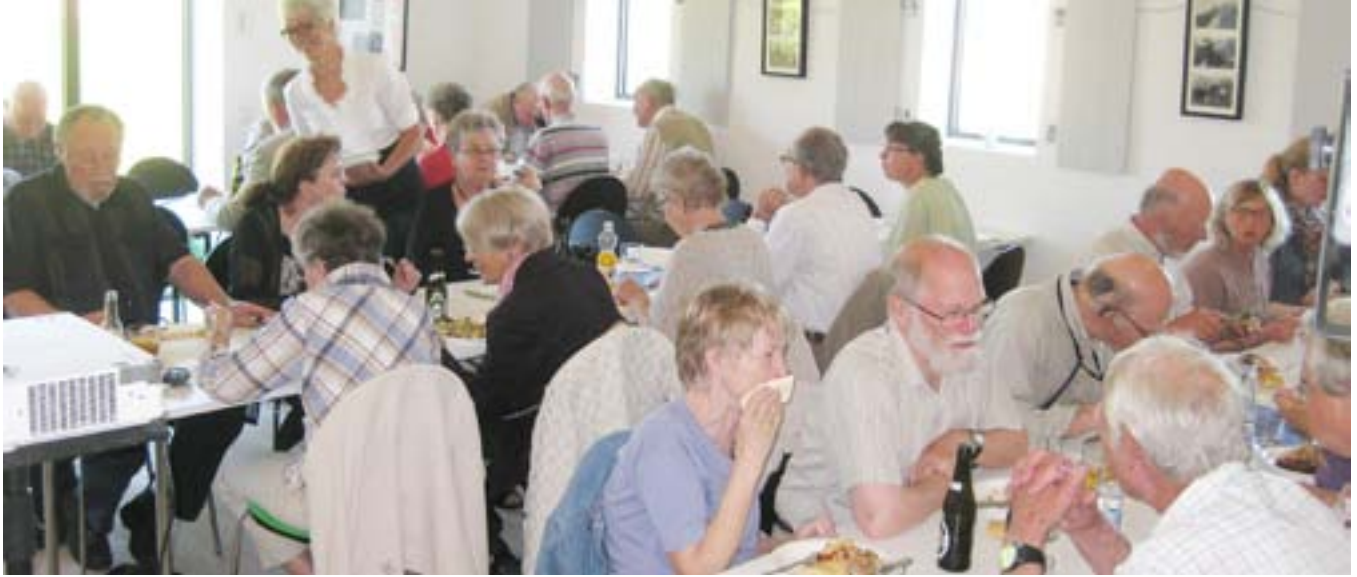
Så var der dækket op til kirkefrokost i Kaj Munks gamle præstegård