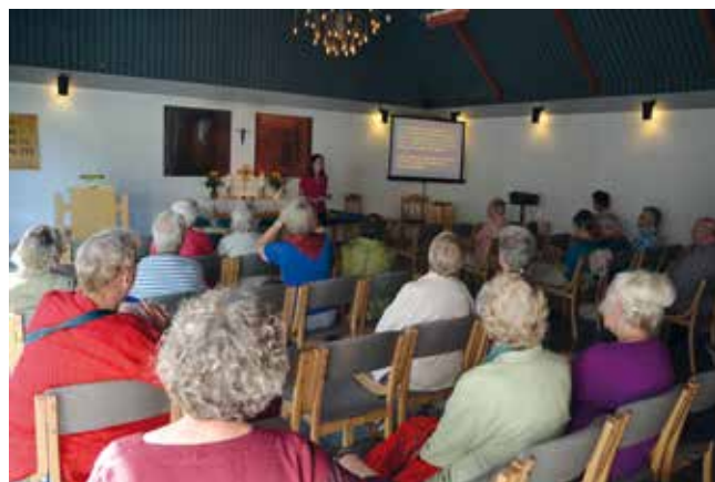
At være på rejse med hørehensyn er ingen hindring for at lave en tekstet gudstjeneste med medbragt skærm og teleslyngesystem. Fra Læk danske Kirke 2014