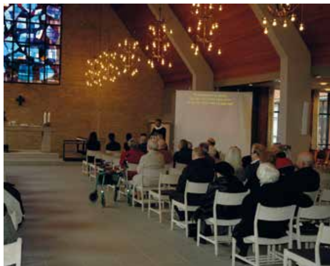
En tekst kan vises på storskærm – her fra Fredenskirken i Viby J

Alt for ofte er hørehæmmede uden for fællesskabet, fordi de ikke kan følge med i, hvad der bliver talt om. Sådan bør det ikke være i kirken, og slet ikke ved gudstjenester. Derfor vil vi helst undgå at skille menigheden i to, hvor hørehæmmede eksempelvis får en særgudstjeneste på et andet tidspunkt end de andre i menigheden.