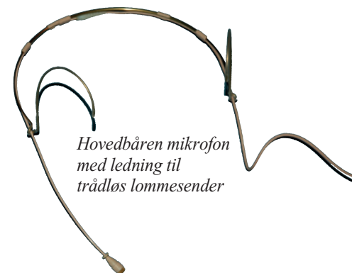
Hovedbåren mikrofon med ledning til trådløs lomme sender