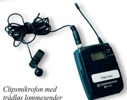
Clipsmikrofon med trådløs lomme sender