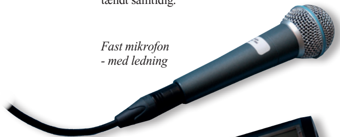
Fast mikrofon - med ledning