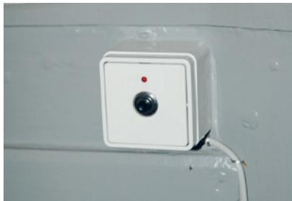
Afbryderknapp til præstens mikrofon

Vær opmærksom på, om der er brug for afbryderknapper til mikrofonen i kirken. Der er afbryder på den sender, som præsten har i lommen, men det er også muligt at få eksterne afbryderknapper installeret centrale steder i kirken f.eks. ved alterbordet, prædikestolen, døbefonten osv.