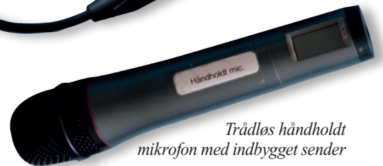
Trådløs håndholdt mikrofon med indbygget sender